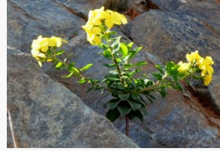
Linum tauricum subsp. bospori – Boğaziçi keteni