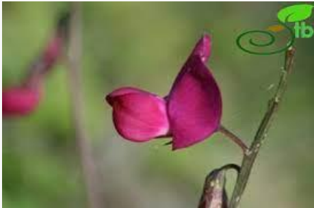
Cephalaria tuteliana – Sultan pelemiri