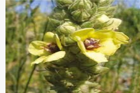
Verbascum degenii – Riva siğirkuyruğu