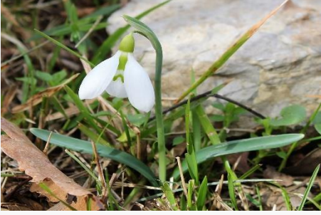
Asperula littoralis – Kum belumotu