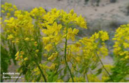
Centaurea hermanii – Peygamber çiçeği