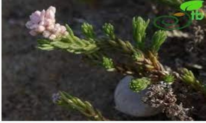
Asperula littoralis – Kum belumotu