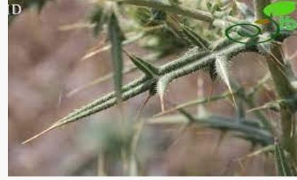
Cirsium byzantinum – Hoşkangal