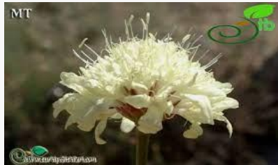
Cephalaria tuteliana – Sultan pelemiri