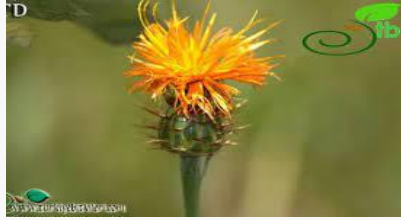
Centaurea hermanii – Peygamber çiçeği