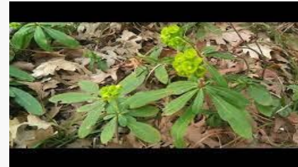
Euphorbia amygdaloides – Zerena, Sütleğen