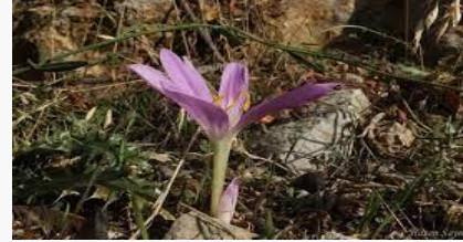
Colchicum micranthum – Narin acııdem