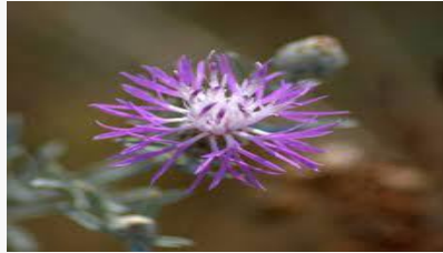
Centaurea kilaea – Kilyosdüğmesi