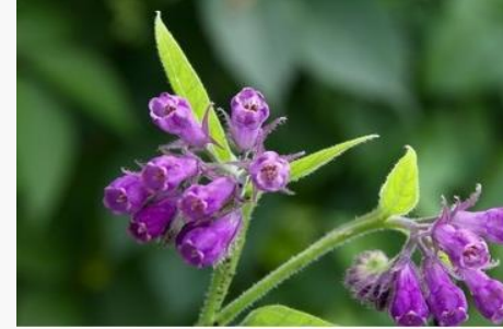
Symphytum pseudobulbosum – Karakafes otu