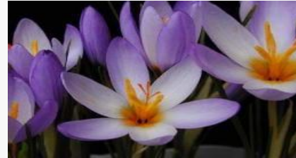
Crocus pestalozzae – Ümraniye çiğdemi